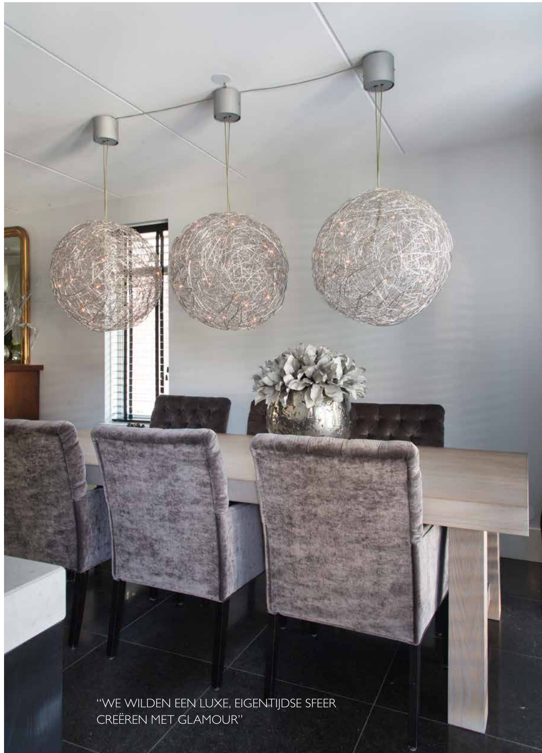
"WE WILDEN EEN LUXE, EIGENTIJDSE SFEER CREËREN MET GLAMOUR"